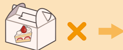
厚紙は主にケーキ箱のように何かを入れる物などに使われるという常識を変え、技術の転用という考えにより、医療現場で使用する「フェイスシールド」ができました。