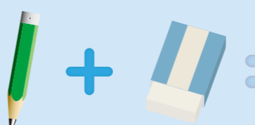
鉛筆に消しゴムをたし算して「消しゴム付き鉛筆」ができました。